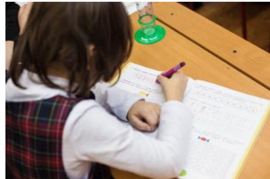
Даша самостоятельно работает на уроке математики

Решения о выборе уроков, которые ребенок будет посещать, об увеличении количества времени нахождения в классе, об уменьшении тьюторской поддержки, согласовываются с учителями общеобразовательного класса. При необходимости учитель ресурсного класса адаптирует учебные материалы под нужды ученика.