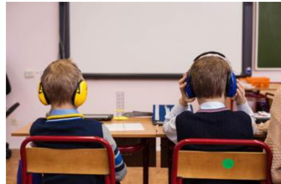
Занятия в сенсорно безопасной и структурированной среде.

Важно помнить, что дети, у которых есть потенциально опасные формы поведения, не включаются в учебный процесс в общеобразовательном классе.