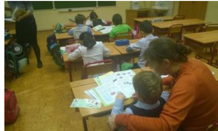
Лев на уроке в сопровождении тьютора.

Для детей с РАС создаются ресурсные классы, в которых проводится подготовка к обучению в обычном классе.