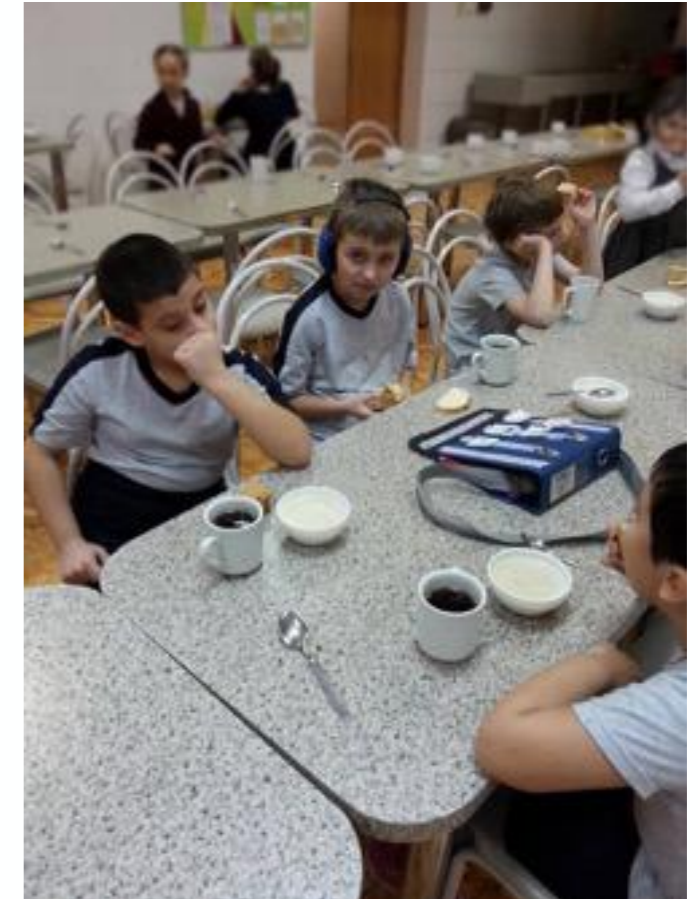
Все вместе на завтраке

После школы ребенку с аутизмом предстоит жить в том же обществе, что и выпускникам обычных школ. Чем раньше они познакомятся друг с другом, тем выше шансы на то, что между ними сложится понимание и взаимодействие. Ребенку с аутизмом, который ходит в школу вместе с обычными детьми, гораздо проще будет ощущать себя частью общества, чем выпускнику коррекционной школы.